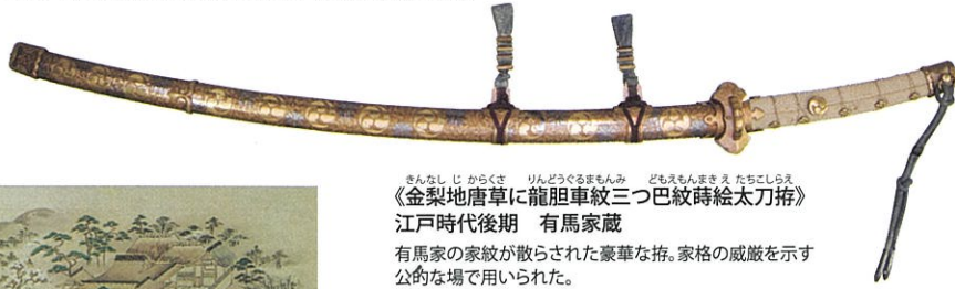
《金梨地唐草に龍胆車紋三つ巴紋時絵太刀拵》 江戸時代後期 有馬家蔵