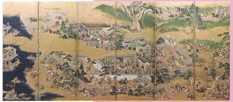
三谷永伯筆《源平合戦図屏風(一ノ谷・屋島)》 江戸時代中期 有馬家蔵 久留米藩お抱え絵師の技術の高さを示す、平家物語にもとづいた合戦図屏風の傑作。