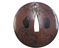
桂永寿作《十二放駒図鐘》