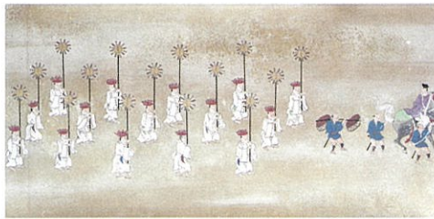
《江南山玉垂宮神幸絵巻》