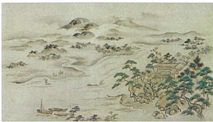
三谷永伯筆《江南山図(伽藍図、靈廟図、臨川亭図)》 江戸時代中期 梅林寺蔵 ※展示替あり