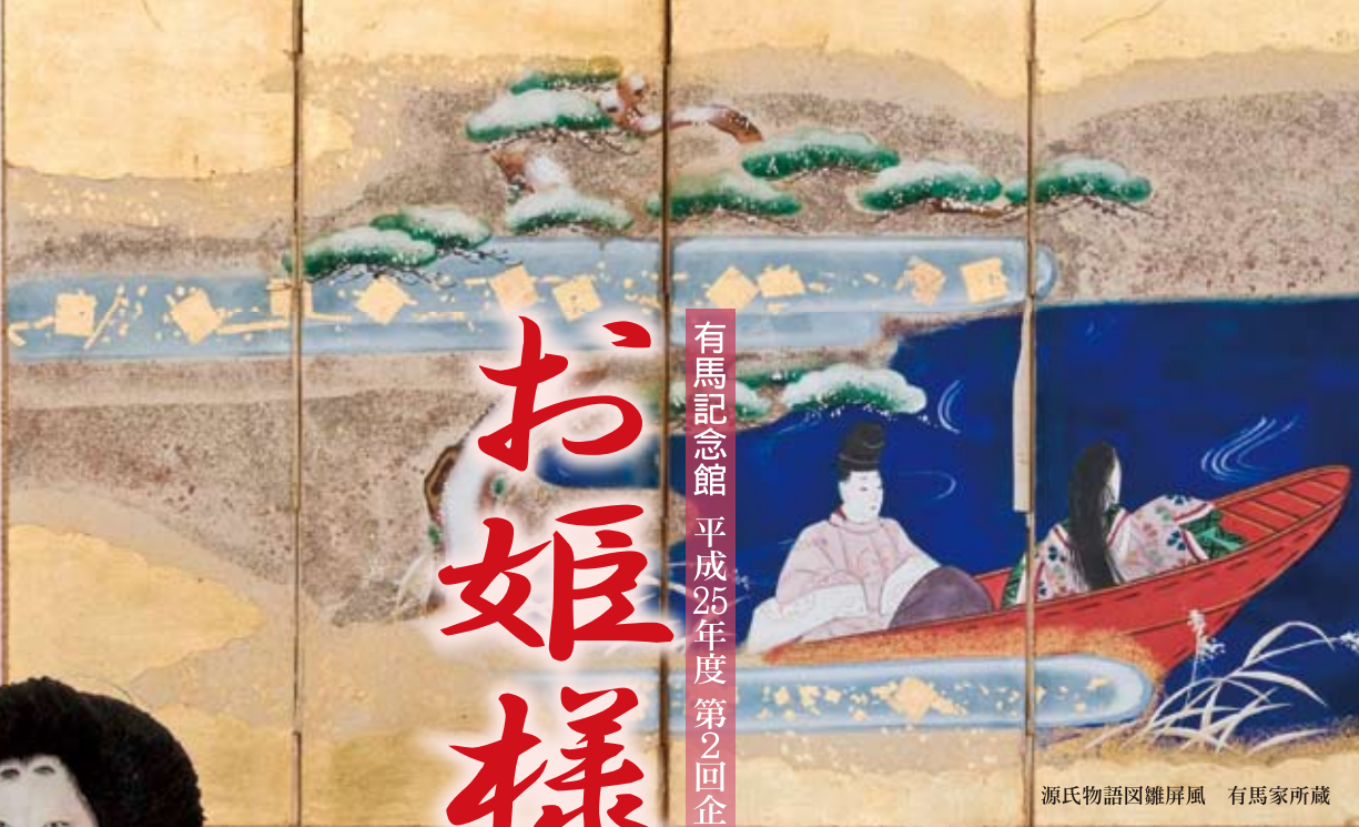
源氏物語図雛屏風 有馬家所蔵