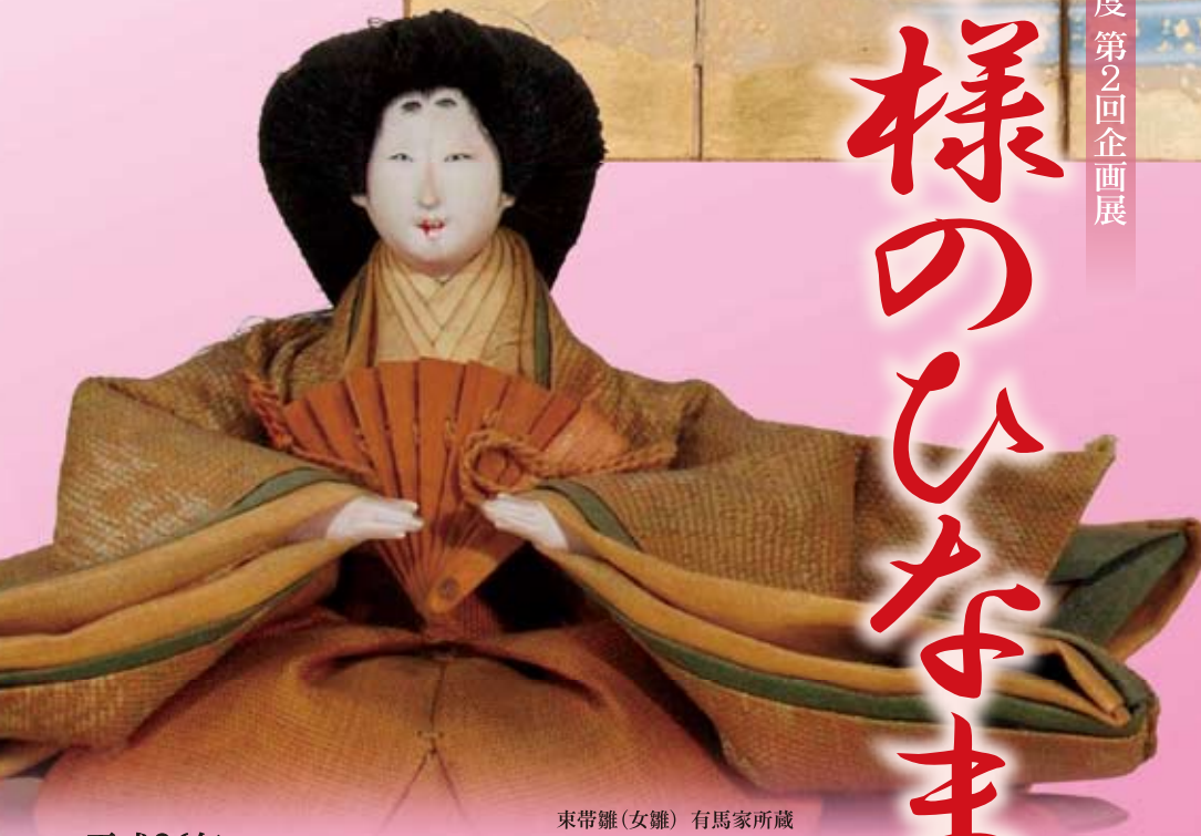
東帯雛(女雛) 有馬家所蔵